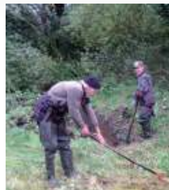
Konservacja rowu na Wilczu