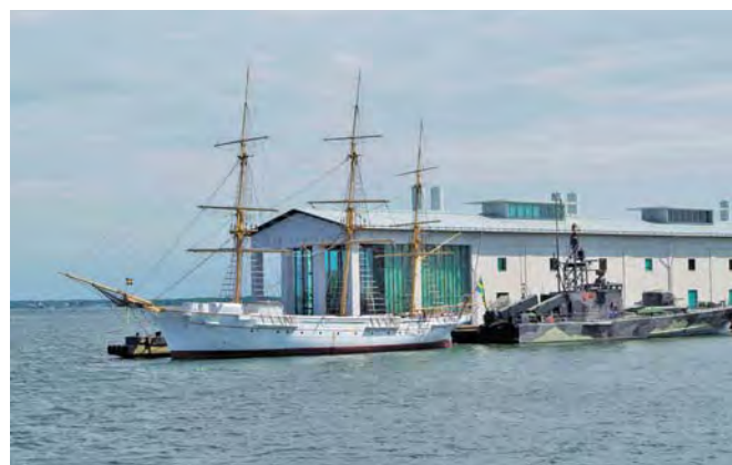
Muzeum Morskie w Karlskronie

Karlskrona jest miastem i portem królewskiej marynarki wojennej wybudowanym u schyłku XVII wieku, obecnie wpisanymi na listę światowego dziedzictwa UNESCO. Centrum znajduje się na wyspie Trossö oddalony od stałego lądu o sześć km. Podróżni podziwiają szerokie ulice, na których ćwiczą musztrę, klasyczne gmachy kościołów, koszar,