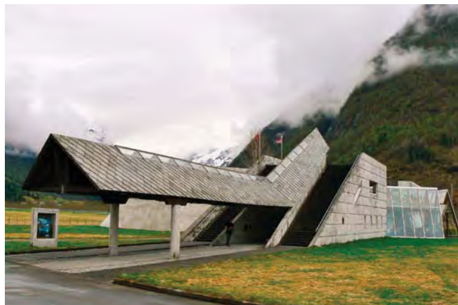
Norweskie Muzeum Lodowców w Fjærland

Przy jednej z odnóg najdłuższego fiordu świata – Sognefjorden – znajduje się wioska, która na pierwszy rzut oka nie różni się od setek sobie podobnych w Norwegii: drewniany kościół na wzgórzu, białe, drewniane domy wzdłuż jedynej ulicy, ośnieżone szczyty gór i języki opadających po zboczach lodowców. Wszystko to ma swoją wierną kopię odbitą w szmaragdowych wodach fiordu. Jednakże w każdym gospodarstwie – w dawnych obórkach, drewniach, stodołach i letnich kuchniach stoją regały z książkami, wśród nich krążą gospodarze – bukiniści, którzy zawsze gotowi są na pogawędkę z klientami. Wioska jest wypełniona antykwariatami. Książki są wszędzie – nawet stojaki na mleko wypełniają półki z książkami. Można tu znaleźć książki z całego świata. Mnie udało się wygrzebać opowieść o Chopinie napisaną po polsku. Na skraju wsi, gdyby literackie wrażenia nie były dostatecznym magnesem przyciągającym gości, wybudowano śmiały architektonicznie budynek Norweskiego Muzeum Lodowców. Można tam nie tylko zapoznać się z ekspozycją prezentującą przyczyny powstawania lodowców, historię osadnictwa wokół lodowców i historię ich eksploracji, ale i zobaczyć film panoramiczny w technologii 5D na temat okalającego wieś lodowca Jostedalbreen.