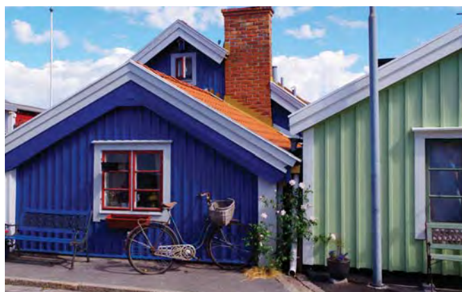
Dzielnica Stoczniovców w Karlskronie