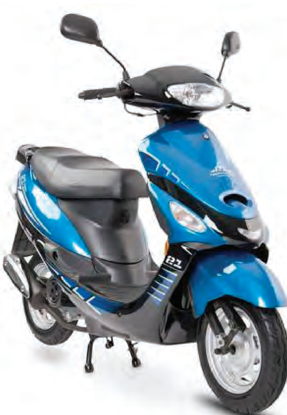
Barton 21, nowy z 2 - letnią gwarancją za niecałe 4 000 zł.

Czytałem kiedyś na WP o podróżniku, który wybrał się w słow podróż skuterkiem o pojemności 50 ccm do Rumunii.