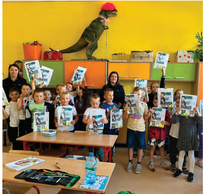
Punkt Sprzedaży Plusa i Polsat Box Osielsko

Pracownicy Plusa życzą wszystkim uczniom sukcesów w nauce, a nauczycielom dużo siły i wytrwałości w kształtowaniu nowego pokolenia.